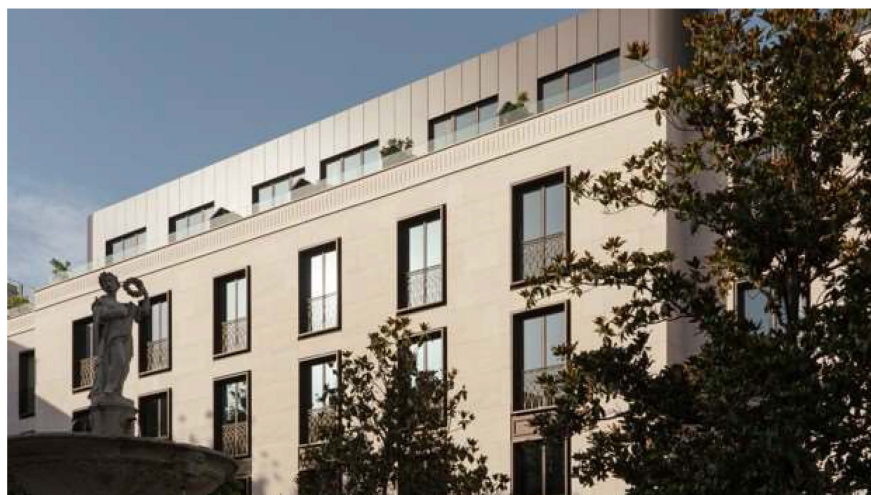
Fachada del hotel de la plaza de la Magdalena

El hotel Radisson de la plaza de la Magdalena recibe huéspedes desde el pasado mes de julio